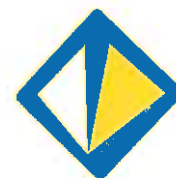
TABELA DE MENSALIDADES DE APOIO Á FAMÍLIA PARA O 1º. CICLO DO ENSINO BÁSICO E PRÉ-ESCOLAR ANO LETIVO DE 2017/2018